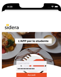
(schermata di accesso)

4) A conferma della prenotazione, il calendario presenterà la giornata di interesse con bollino arancione; cliccare sulla giornata di prenotazione per visualizzare il QrCode valido solo per quella prenotazione ( non utilizzabile più volte ) e che identifica in maniera univoca l'utente e la selezione (giorno e luogo) effettuata. Si vedano le immagini di seguito.