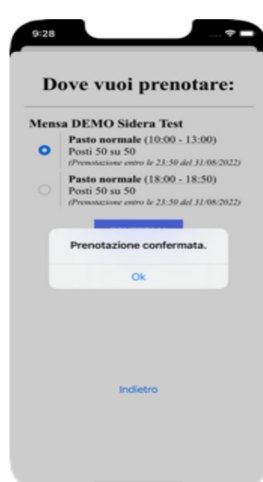
(messaggio di prenotazione confermata)