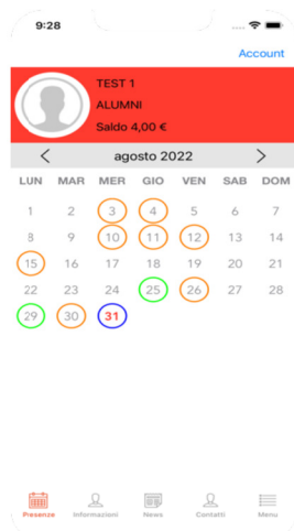
(calendario mensile per prenotazione pasto)