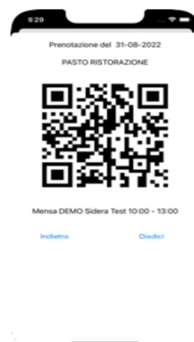
(QRcode di prenotazione)

Il QRcode può essere fotografato, stampato o salvato sul proprio telefono e dovrà successivamente essere esibito all'operatore della mensa o al personale del ristorante ai fini del riconoscimento.