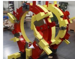
Maschine für Reifenherstellung (Minenfahrzeuge)-macchina per produzione pneumatici mineria