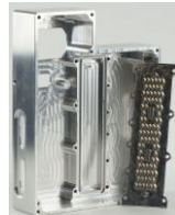
Steuergehäuse - centralina E-car BMW i3