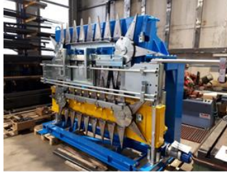
Maschine zur Bearbeitung von Betonstahl macchina per lavorazione di acciaio armato