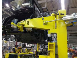
Montagelinie - linea montaggio per Porsche Cayenne