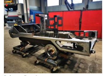
Rahmen Entminungspanzer telaio carro blindato anti mine