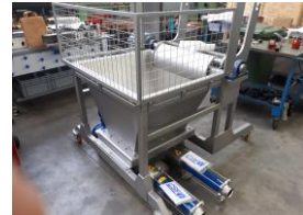
Kipp- und Fördereinheit Strudelgemisch - assemblaggio ribaltamento ed estrazione impasto strudel

UNSER TEAM - DEINE CHANCE IN EINE SPANNENDE ZUKUNFT! LA NOSTRA SQUADRA - LA TUA OCCASIONE PER UN FUTURO APPAGANTE E PIENO DI SODDISFAZIONI!