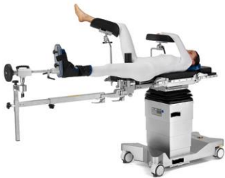
Operationstisch letto operatorio

Il nostro motto: „Impossibile“ non fa parte del nostro vocabolario!